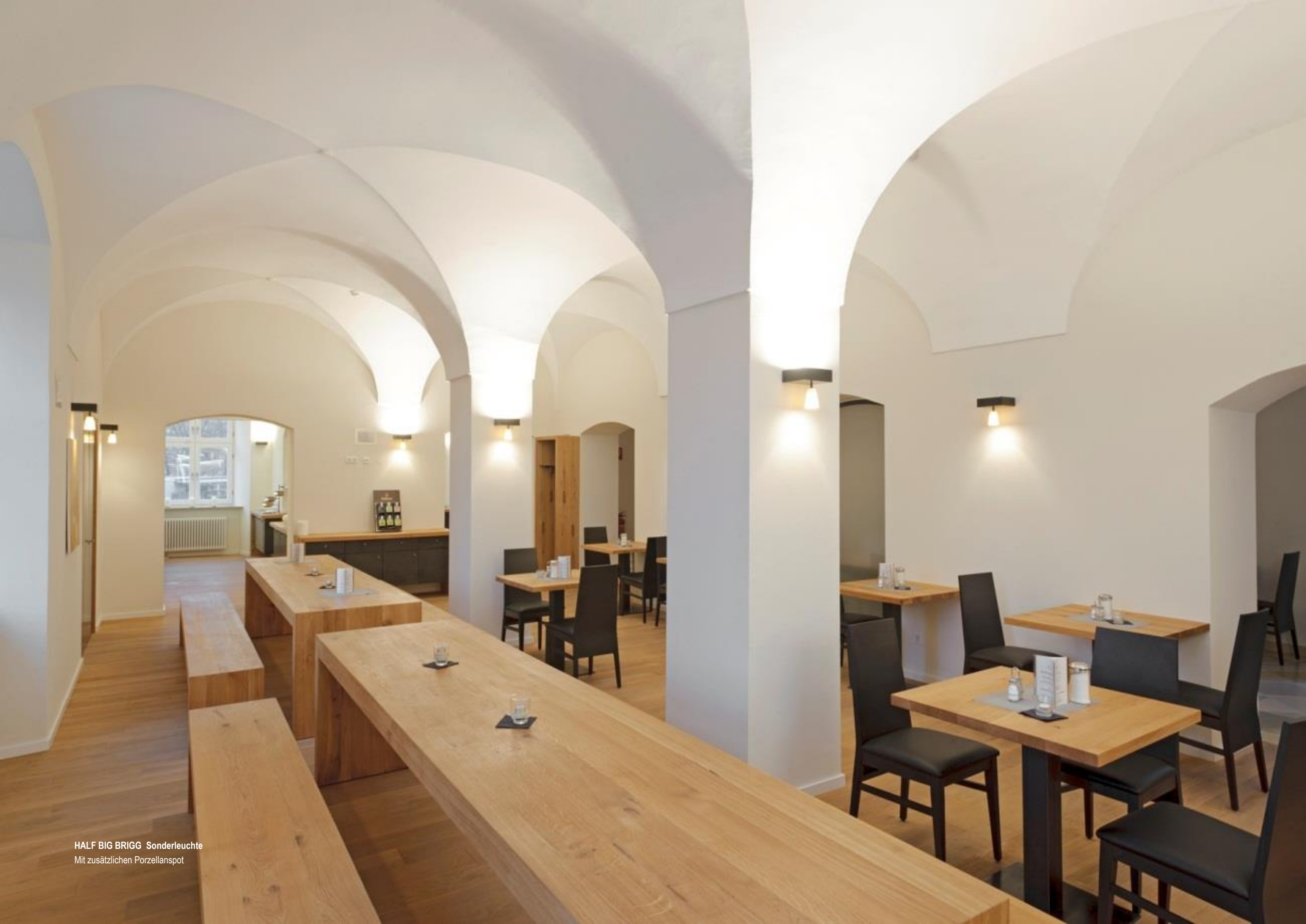
HALF BIG BRIGG Sonderleuchte Mit zusätzlichen Porzellanspot