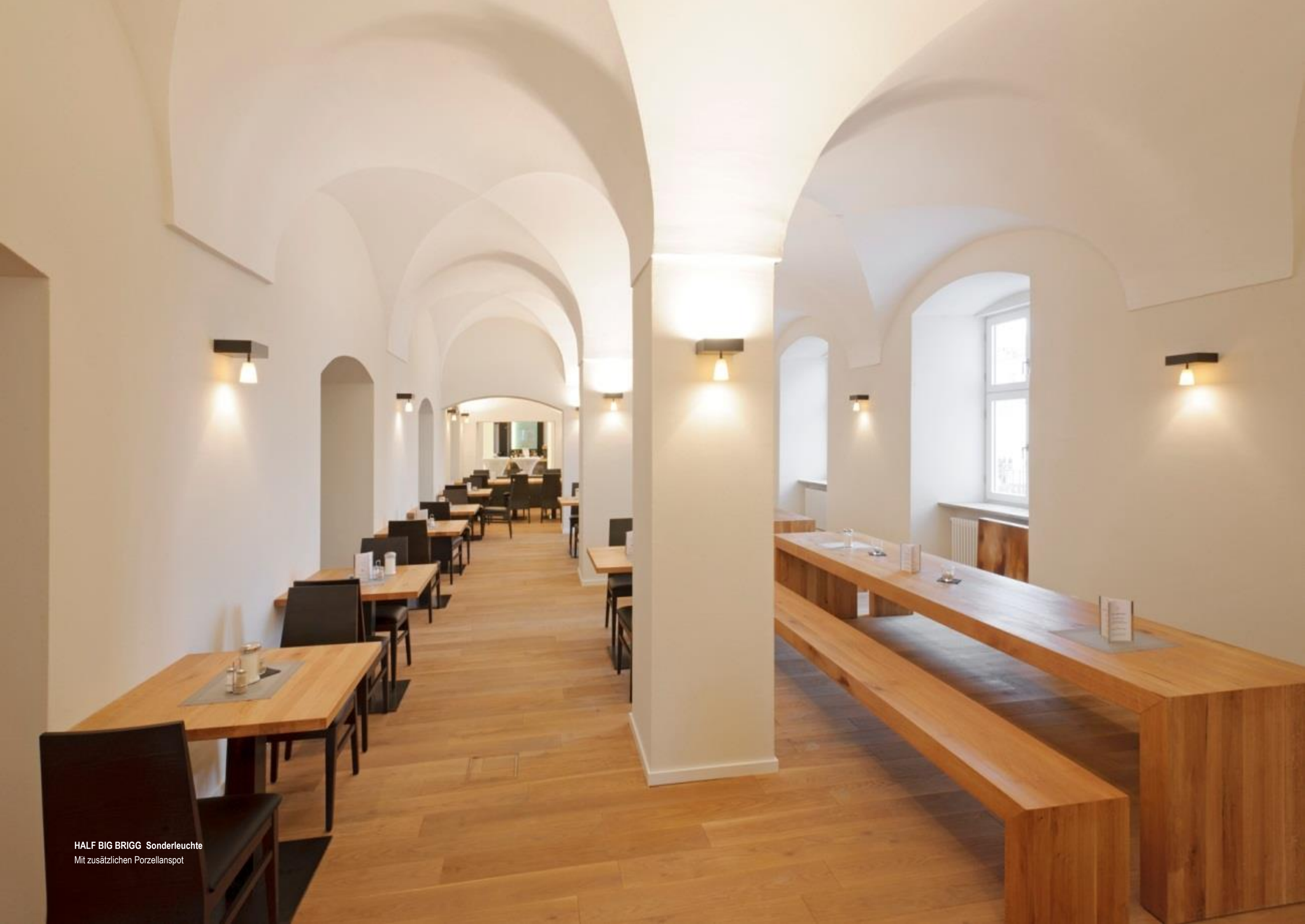
HALF BIG BRIGG Sonderleuchte Mit zusätzlichen Porzellanspot