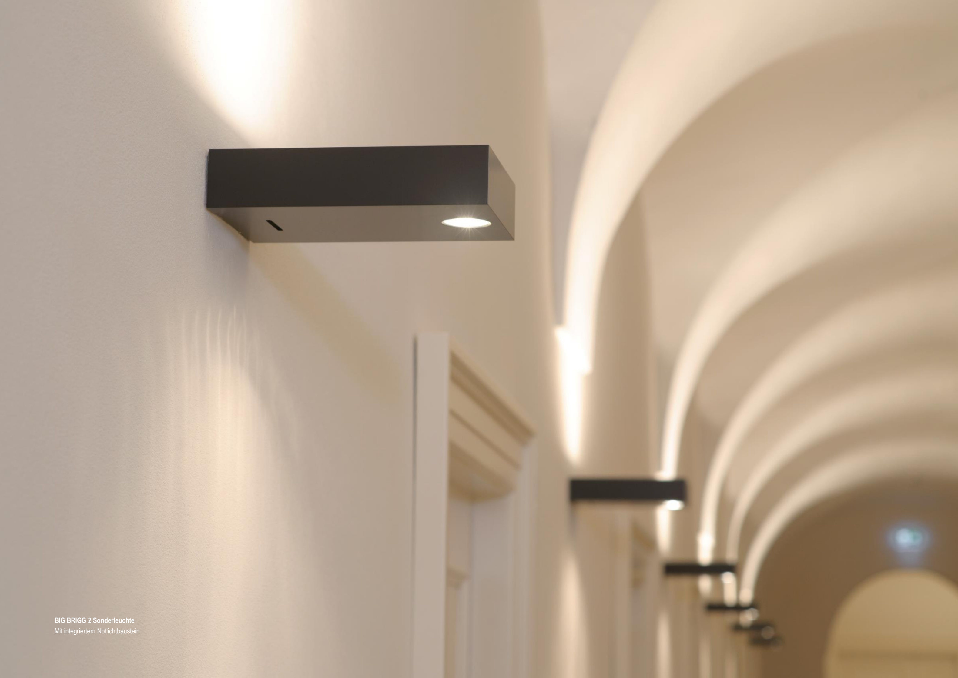
BIG BRIGG 2 Sonderleuchte Mit integriertem Notlichtbaustein