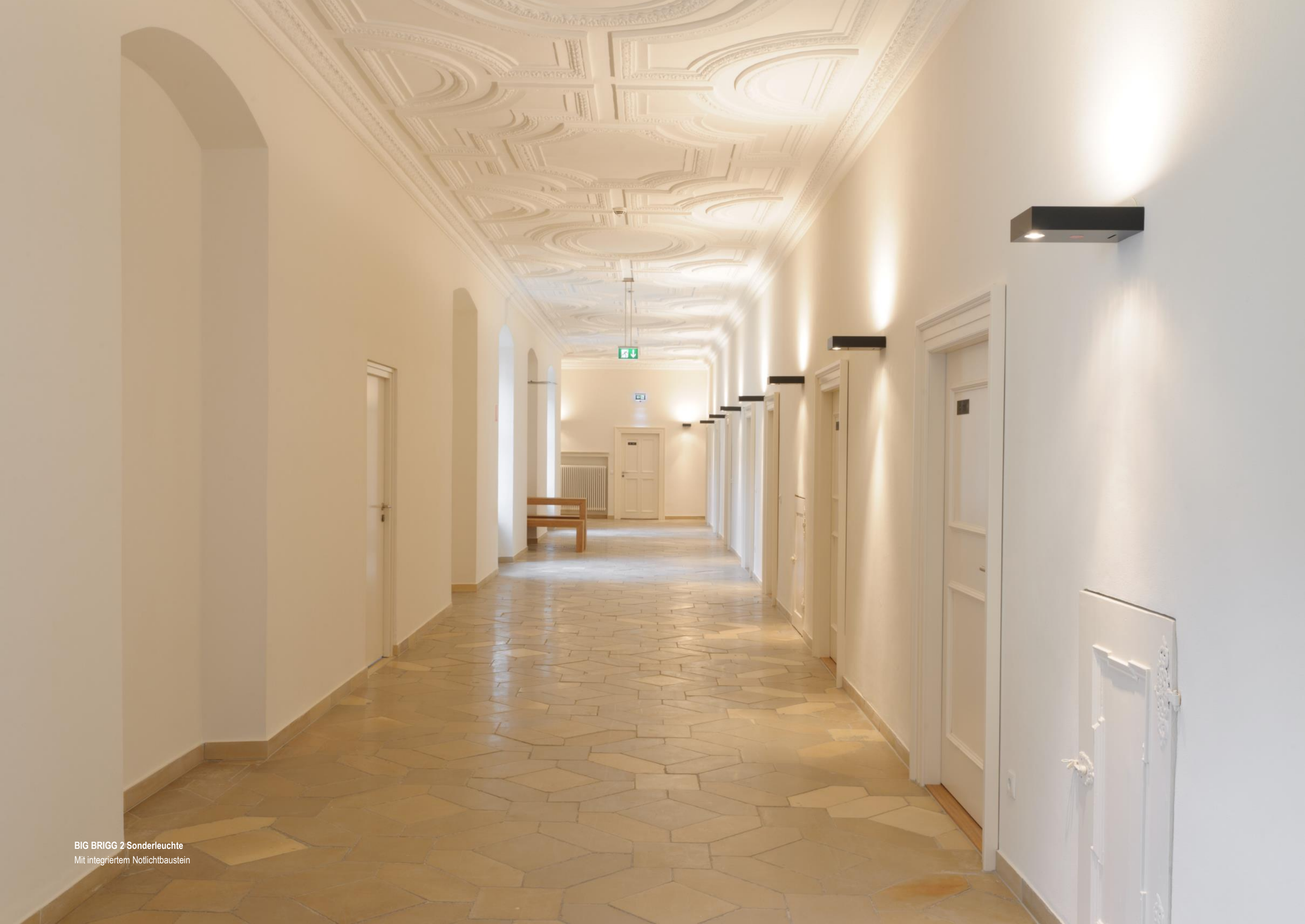
BIG BRIGG 2 Sonderleuchte Mit integriertem Notlichtbaustein