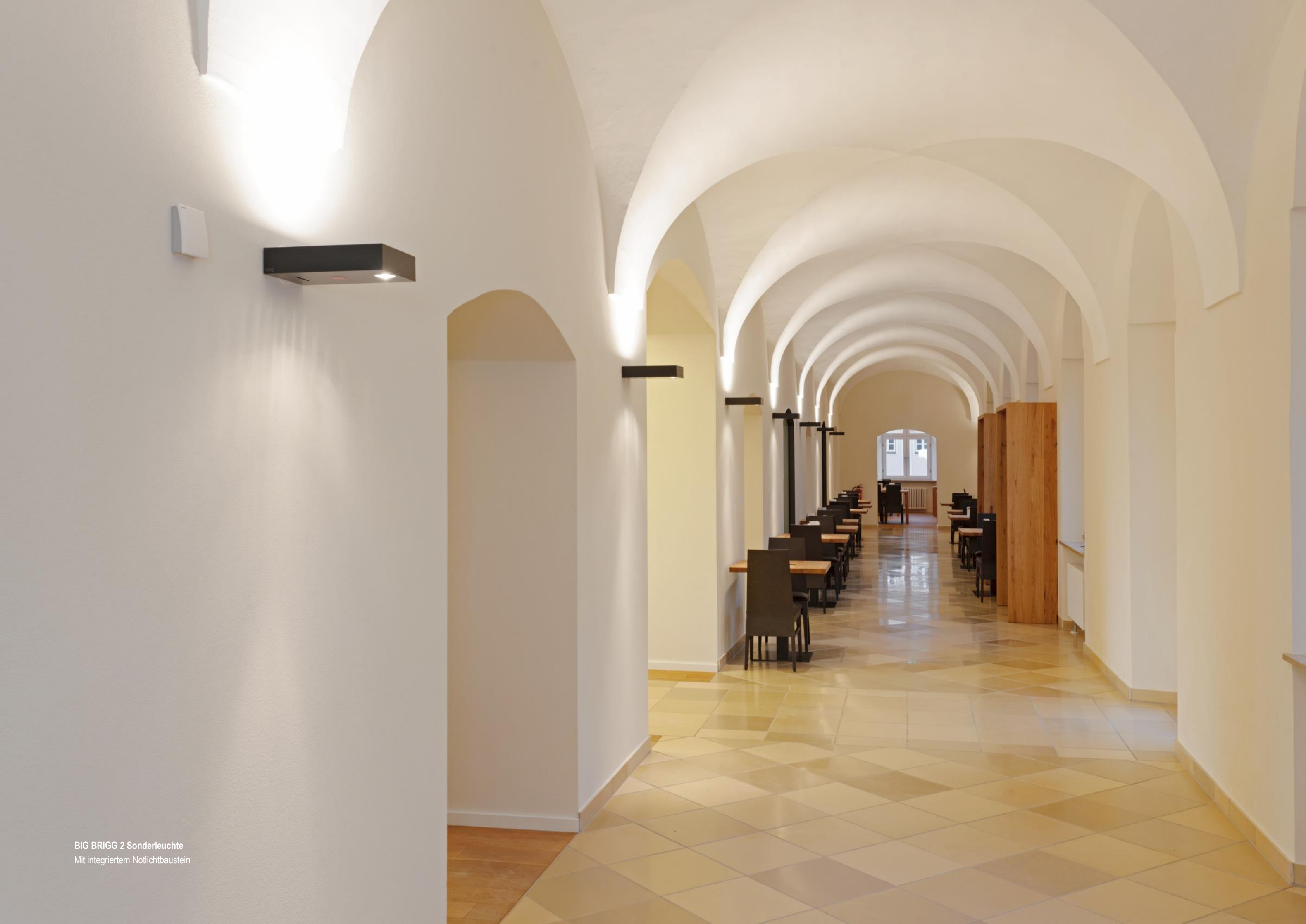
BIG BRIGG 2 Sonderleuchte Mit integriertem Notlichtbaustein