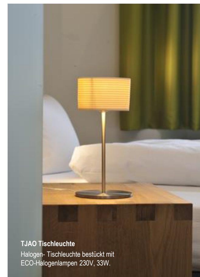
TJAO Tischleuchte Halogen- Tischleuchte bestückt mit ECO-Halogenlampen 230V, 33W.