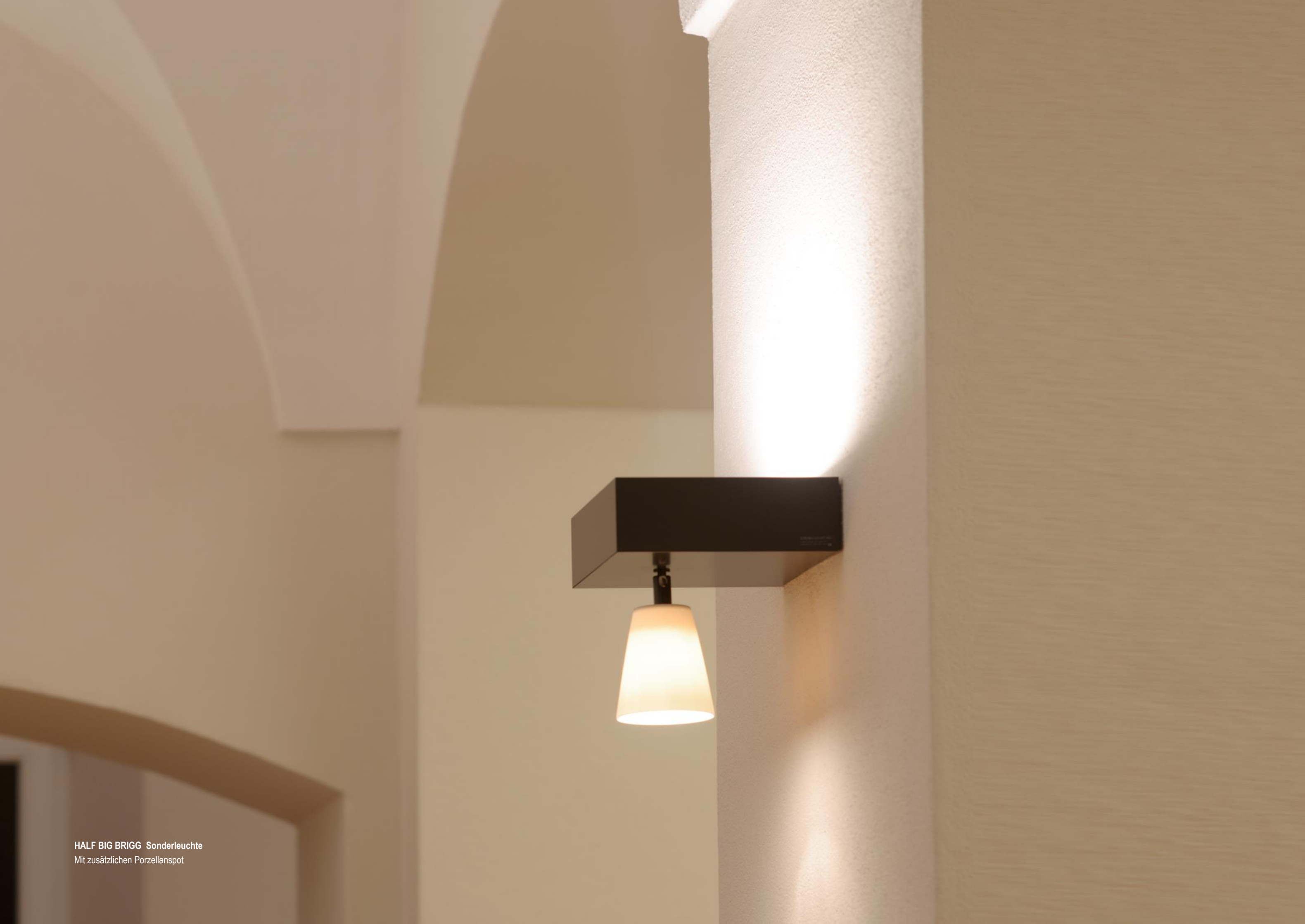
HALF BIG BRIGG Sonderleuchte Mit zusätzlichen Porzellanspot