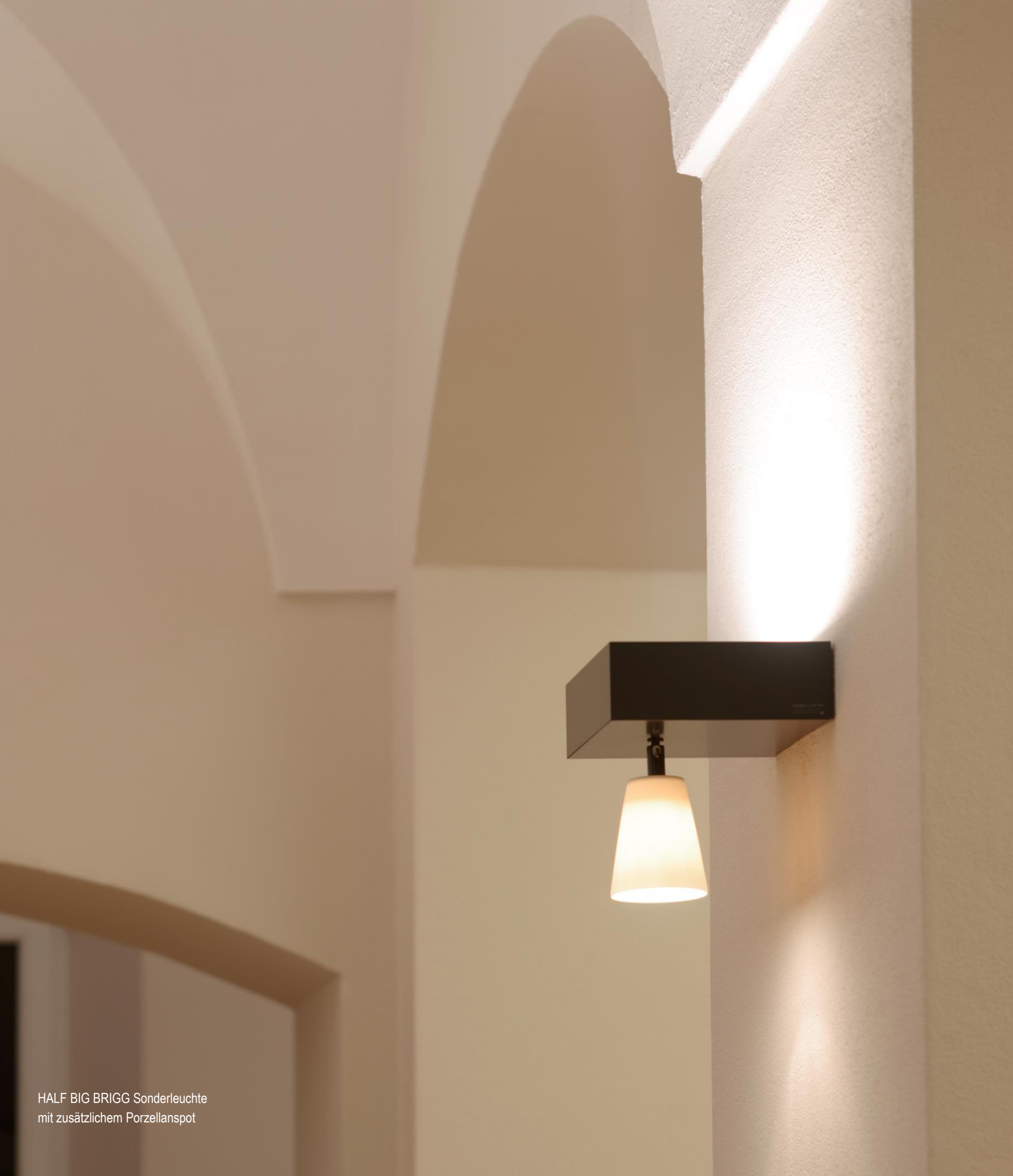
HALF BIG BRIGG Sonderleuchte mit zusätzlichem Porzellanspot