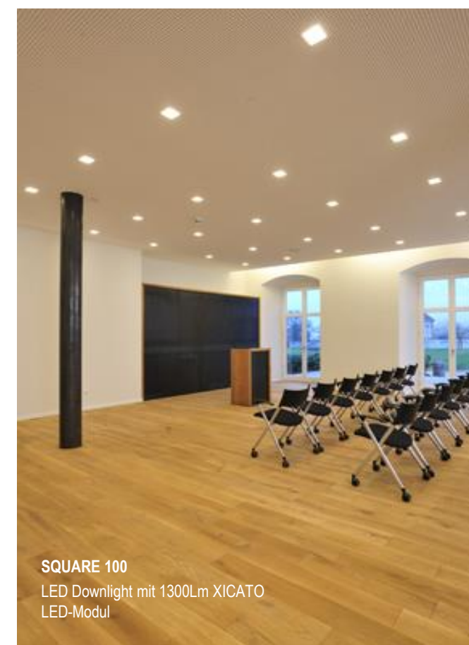
SQUARE 100 LED Downlight mit 1300Lm XICATO LED-Modul