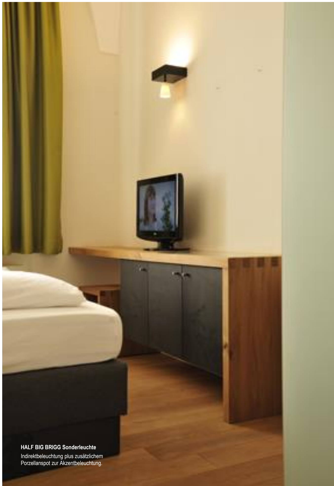
HALF BIG BRIGG Sonderleuchte Indirektbeleuchtung plus zusätzlichem Porzellanspot zur Akzentbeleuchtung.